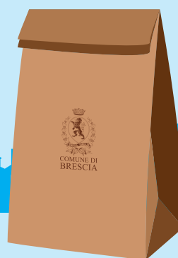
Carta e Cartone